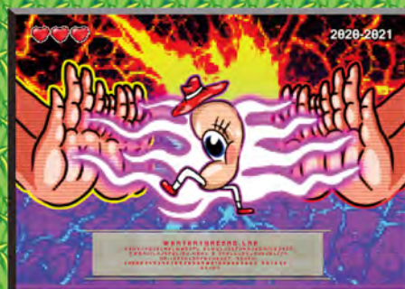
增實力 音響工程專家指點