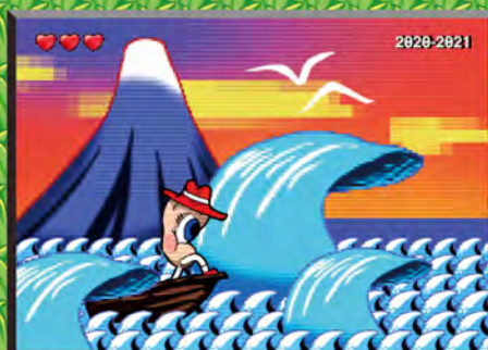
築願景 音樂潮流產業趨勢