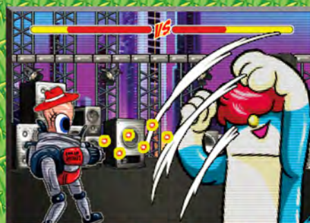
強技能 現場表演實戰培訓