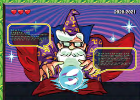
點迷津 廠牌營運推廣貼士