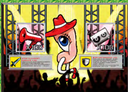
打基礎 版權版稅行業規則