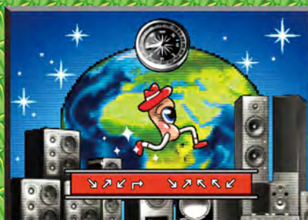
搭橋樑 國際嘉賓全球網絡