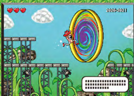
指明路 資深樂人師友嚮導