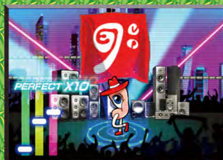
吸粉絲 音樂演出拓闊觀眾